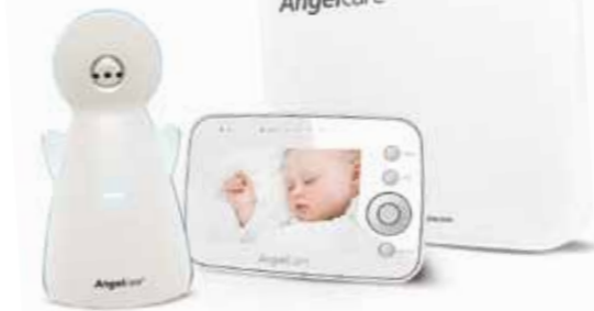
Le nouveau moniteur vidéo, mouvements & sons AC1300