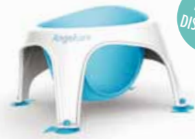
L'anneau de bain Confort et liberté de mouvements