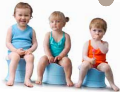
Le pot d'apprentissage 3 hauteurs conçu avec des psychomotriciens Le seul pot qui s'adapte à la taille de l'enfant et non l'inverse !