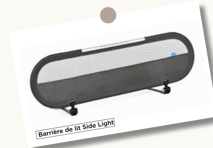
Barrière de lit Side Light