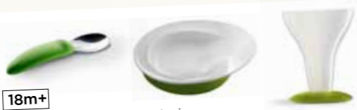
18m+ L'assiette, les couverts inox et le verre d'apprentissage