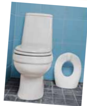
Le réducteur de WC Il s'adapte à toutes les lunettes et se range debout !