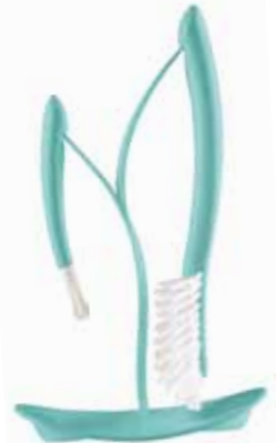
Goupillon et support Pour le maximum d'hygiène !