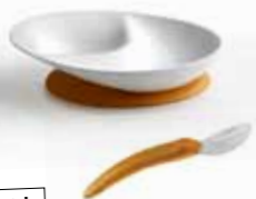
6m+ L'assiette découverte des saveurs et la cuillère de transition