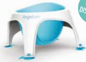
L'anneau de bain Confort et liberté de mouvements