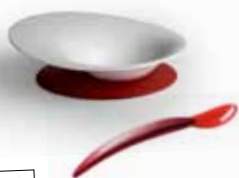
4m+ L'assiette bonne température et la cuillère thermosensible