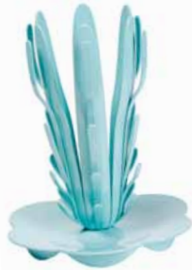
Egouttoir 6 biberons Le seul égouttoir qui organise !