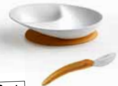
6m+ L'assiette découverte des saveurs et la cuillère de transition