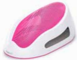
Le transat de bain Ergonomique & sécurisant

Nos produits sont conçus pour aider les enfants à acquérir une totale propreté. Du premier bain, instant de plaisir et de partage, à l'acquisition de la propreté, Angelcare accompagne les enfants en proposant des produits astucieux, ultra confortables et au look résolument design.