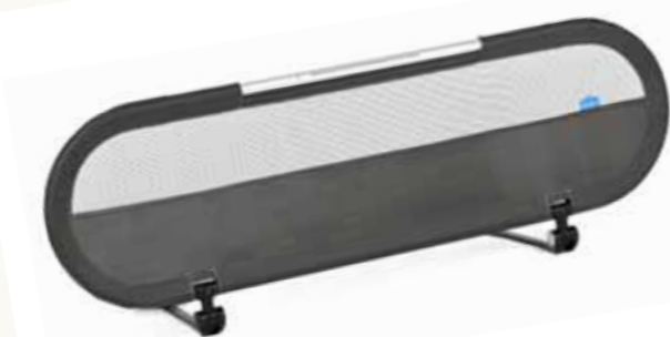
Barrière de lit Side Light