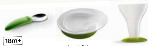
18m+ L'assiette, les couverts inox et le verre d'apprentissage