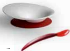
4m+ L'assiette bonne température et la cuillère thermosensible